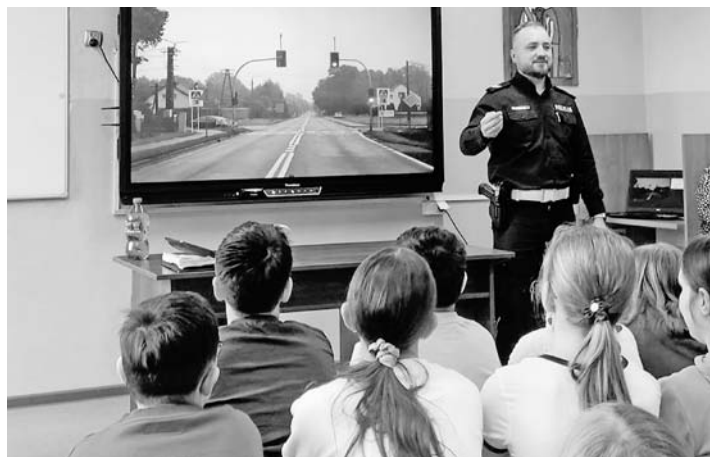
To było bardzo pouczające spotkanie