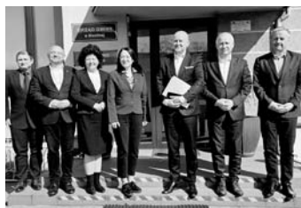
W konwencie udział wzięli starosta oraz wójtowie gmin naszego powiatu

Kolejnym ważnym punktem spotkania były inwestycje drogowe na drogach powiatowych planowane na 2026 rok. Jedną z kluczowych inwestycji będzie przebudowa ul. Pszczyńskiej w Woli.