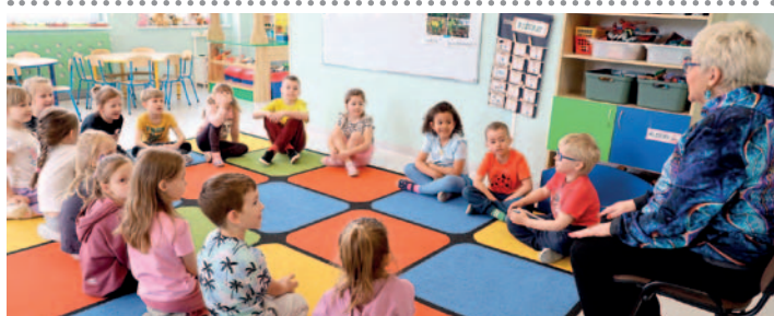
Specjaliści wprowadzają dzieci i młodzież w magiczny świat teatru

We wszystkich placówkach oświatowych naszej gminy odbywają się warsztaty teatralne dla dzieci i młodzieży, zorganizowane przez Gminny Ośrodek Kultury.