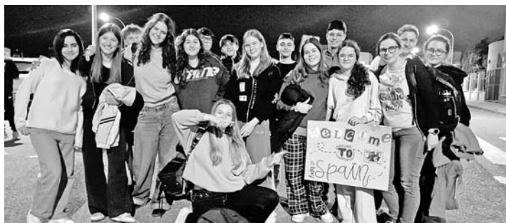
To kolejne międzynarodowe przygody młodzieży z gilowickiego liceum

Uczniowie gilowickiego liceum korzystają z możliwości, jakie daje Unia Europejska oraz program Erasmus+. W marcu dwie grupy uczniów oraz nauczycieli pojechały do Włoch oraz do Hiszpanii. Obie przygody pozwoliły na zwiedzanie, poznawanie lokalnej kultury, integrację oraz szlifowanie języków obcych. We Włoszech, a konkretnie w Calabrii młodzież odwiedziła m.in. muzeum, które pokazuje historię największego obozu koncentracyjnego zbudowanego we Włoszech podczas II wojny światowej,