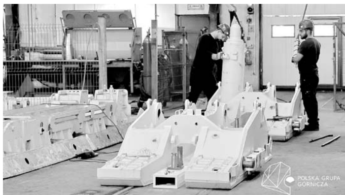
Spółka podkreśla, że koncesja to szansa na rozwój zakładu w Woli wobec malejącej liczby zamówień z kopalń

Koncesję wydano dla PGG S.A. na 50 lat. Miejscem wykonywania działalności o przeznaczeniu militarnym jest jeden z wydziałów produkcyjnych bieruńskiego ZRP, mieszczący się na terenach pokopalnianych w Woli. Jak podkreśla PGG, koncesja daje szerokie możliwości i otwiera przed Zakładem Remontowo-Produkcyjnym rynek towarów i technologii o przeznaczeniu wojskowym i policyjnym, zarówno w zakresie produkcji, jak i pośrednictwa w sprzedaży produktów militarnych. Jako podwykonawca dużej