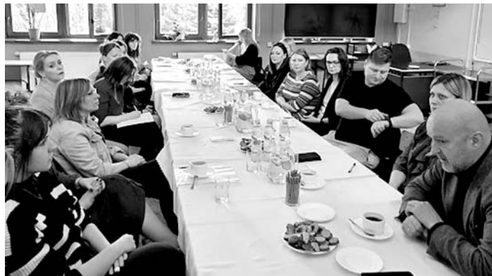
Hejt to problem, który dotyka coraz więcej osób, dlatego trzeba stanowczo z nim walczyć

Podczas dyskusji podkreślono znaczenie działań profilaktycznych skierowanych nie tylko do uczniów, ale także do osób dorosłych. Zwrócono uwagę na