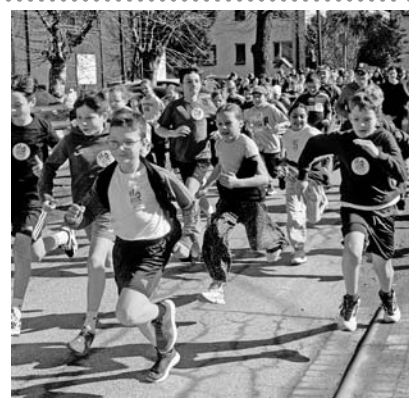
W aktywny sposób uczniowie upamiętnili żołnierzy podziemia