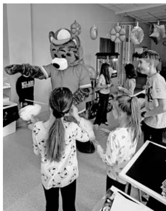
Świetlica wznowiła działalność. Dużo się tam dzieje

natomiast panie psycholożki z Centrum Rozwoju Wisienka, z którymi Gminny Ośrodek Pomocy Społecznej rozpoczął współpracę w ramach działalności świetlicy. Mamy nadzieję, że świetlica będzie twórczą i przyjazną przestrzenią, do której chce się wracać. Życzymy, by pobyt w placówce przyczynił się do odkrycia i rozwoju pasji, a każdy kolejny dzień przyniósł nam mnóstwo uśmiechu, kreatywnej zabawy i wzajemnego wsparcia.