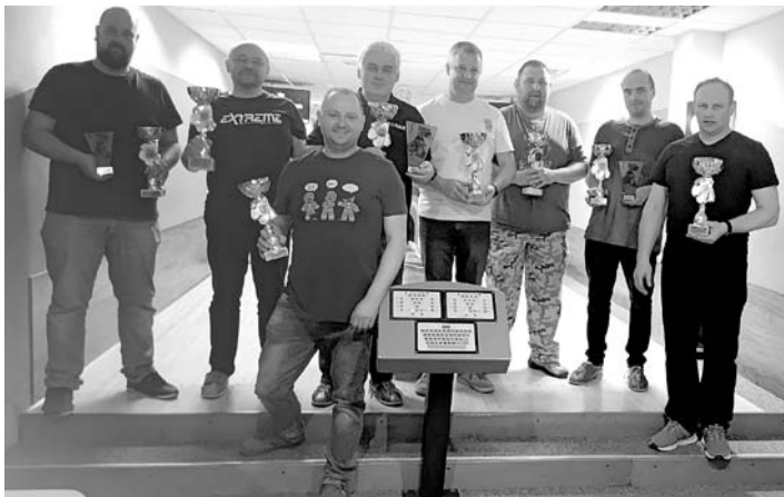
Tym razem druhowie spotkali się na kręgielni