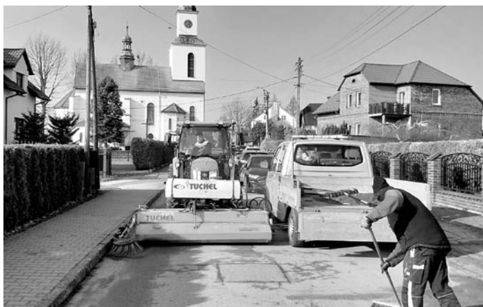
Wiosenne porządki na gminnych drogach

Z zadań drogowych, planowane są przebudowa ul. Leśnej w Gilowicach oraz ul. Słonecznej w Miedznej. Rozstrzygnię-