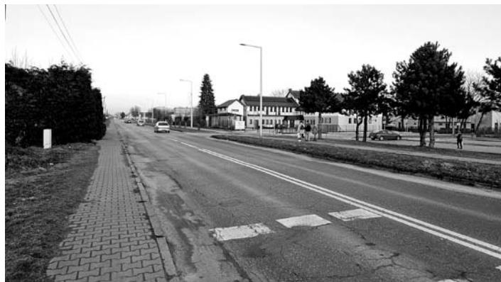
Roboty będą realizowane na odcinku 2,4 km

Powiat Pszczyński otrzymał właśnie 2,5 mln zł dofinansowania z Rządowego Funduszu Rozwoju Dróg na przebudowę ul. Pszczyńskiej w Woli. Chodzi o odcinek o długości 2,4 km – od ulicy Kopalnianej do ulicy Oświęcimskiej (przebudowę na odcinku z Gilowic do skrzyżowania z ul. Kopalnianą w Woli prowadzono w 2015 roku). Zakres prac obejmuje przebudowę jezdni, ale również wykonanie chodnika, ścieżki rowerowej oraz ciągu pieszo-rowerowego. W ramach zadania powstaną miejsca postojowe oraz zatoka autobusowa. Projekt przewiduje ponadto niwelację terenu, przebudowę skrzyżowań, oświetlenia ulicznego i budowę kanalizacji deszczowej.