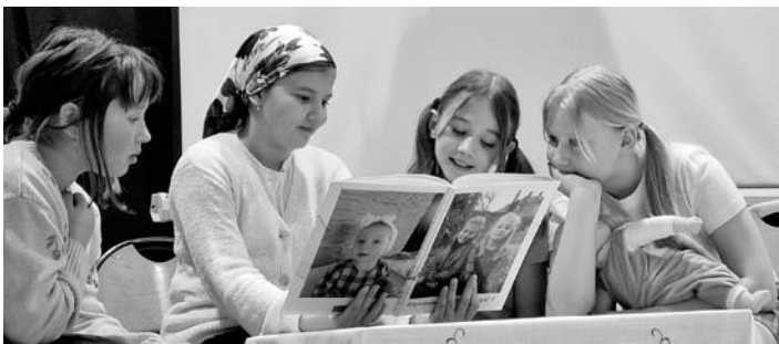
Uczniowie wiedzą, że musimy dbać o nasz język ojczysty

13 lutego w Szkole Podstawowej im. Janusza Korczaka w Górze obchodzono Międzynarodowy Dzień Języka Ojczystego, który przypada 21 lutego. Święto to zostało ustanowione przez UNESCO 17 listopada 1999 roku. Jego data upamiętnia wydarzenie w Bangladeszu, gdzie w 1952 roku pięciu studentów uniwersytetu w Dhace zginęło podczas demonstracji, w której domagano się nadania językowi bengalskiemu statusu języka urzędowego. Akademia w szkole była