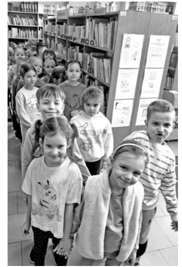
Przedszkolakom bardzo podobało się w szkole