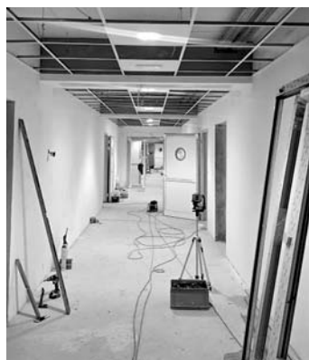
W nowym żłobku dużo się dzieje

Zbliża się przebudowa ul. Leśnej w Gilowicach. W ramach przygotowań terenu zakończono wycinkę drzew. Wkrótce rozstrzygnięty zostanie przetarg, który obejmuje też przebudowę ul. Słonecznej w Miedźnej. Gmina Miedźna szuka też firmy, która wybuduje plac zabaw przy powstającym żłobku w Woli. Wkrótce powinna ruszyć