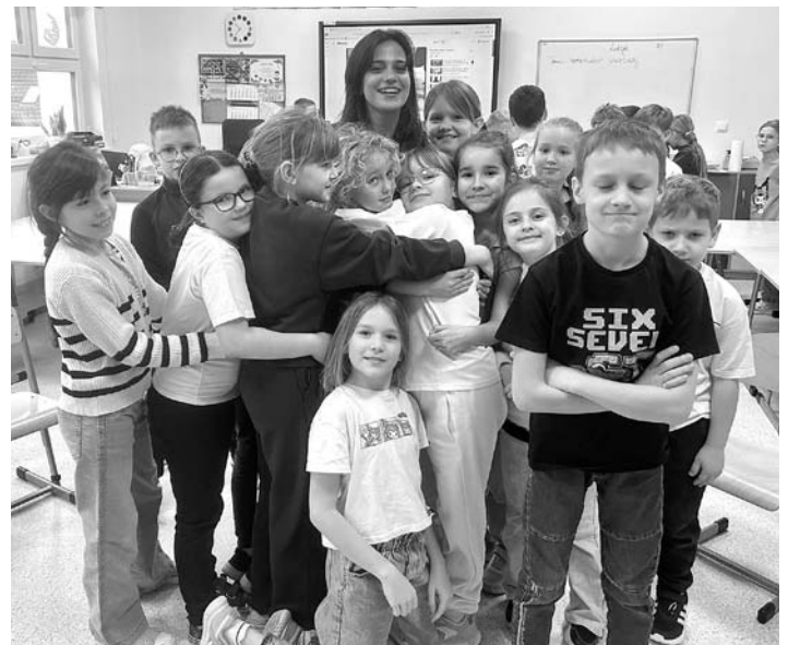
Dzieci polubiły gościa z Włoch