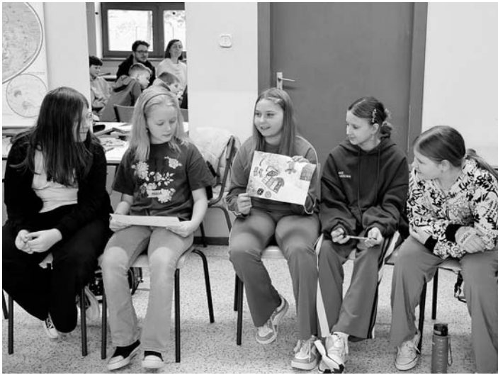
Uczniowie wyobrażali sobie, co by zrobili na bezludnej wyspie

Uczniowie Szkoły Podstawowej nr 2 z Oddziałami Integracyjnymi im. Jana Pawła II w Woli w ramach lekcji wychowawczych realizują projekt „Edukacja bez przemocy”. Klasa IVa wzięła udział w warsztatach z przedstawicielami Fundacji Owoc Spotkania. Dzieci miały okazję wyobrazić sobie, co by zrobiły gdyby znalazły się na bezludnej wyspie, jakie umiejętności mogłyby wykorzystać aby na niej przetrwać. Dzięki temu udało się poruszyć temat współpracy, asertywności jak również przemocy i hejtu. W klasie Va podczas zajęć uczestnicy uczą się rozwijać postawę empatii, szacunku i współpracy, lepiej się poznając i budując dobre relacje rówieśnicze. Rozpoznają różne formy przemocy oraz