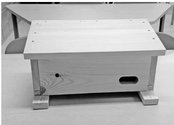
Budka dla jerzyków stworzona przez uczniów szkoły w Miedźnej

Dlaczego jerzyki są tak cenne dla człowieka? Bo są naszymi naturalnymi sprzymierzeńcami w walce z uciążliwymi owadami. Jeden ptak potrafi zjeść nawet około 2000 owadów dziennie – komarów, meszek i much. Kolonia jerzyków w okolicy to realnie mniej dokuczliwych insektów, bez chemii i bez kosztów.