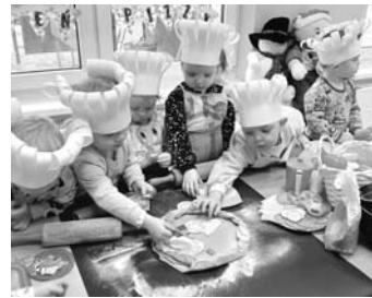
W żłobku powstały wyjątkowe pizze