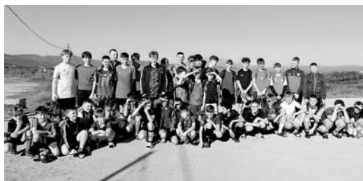
To była wspaniała przygoda dla młodych piłkarzy

Ferie zimowe były niezwykle ciekawym czasem dla podopiecznych Junior Football Frydek. Grupa młodych piłkarzy pojechała bowiem na tygodniowy obóz sportowy do Hiszpanii! Te wspaniałe dni wypełniły treningi, mecze sparingowe z lokalnymi drużynami, zajęcia piłkarskie. Był też czas na integrację, relaks i rekreację, zwiedzenie oraz prawdziwą perelkę – wyjazd na mecz FC Barcelony i niezwykłą atmosferę podczas spotkania jednego z najlepszych klubów na świecie!