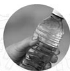
jednorazowe butelki z tworzyw sztucznych o pojemności do 3 litrów