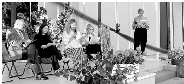
Tegoroczne czytanie poświęcone było twórczości Jana Kochanowskiego