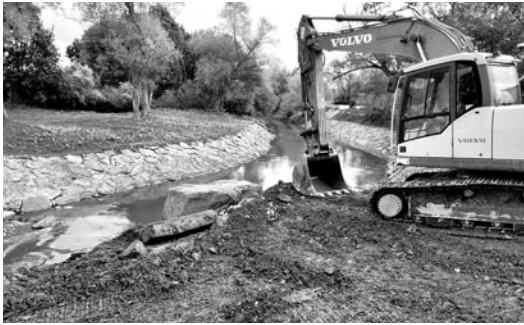
Poprawa bezpieczeństwa przeciwpowodziowego to cel zadania realizowanego przez Wody Polskie w Górze