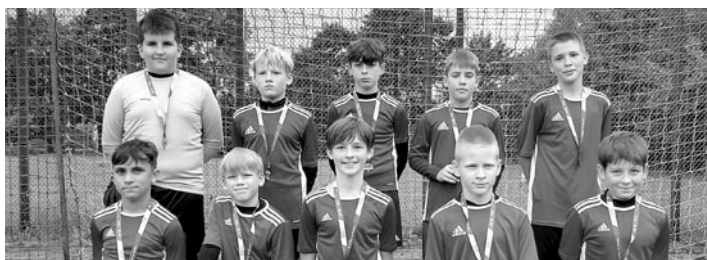
Reprezentacja szkoły, która wygrała w kategorii U 13

17 września Zespół Szkolno-Przedszkolny w Miedźnej był organizatorem turnieju piłki nożnej w ramach programu „Z Orlika na stadion”. Po murawie boiska biegali uczniowie wszystkich szkół podstawowych naszej gminy walcząc o zwycięstwo i awans do etapu regionalnego. Każdy z 60 zawodników otrzymał pamiątkowy medal, sporą dawkę endorfin, adrenaliny i zdrowia. W kategorii U 13 bezapelacyjnie najlepsi okazali się