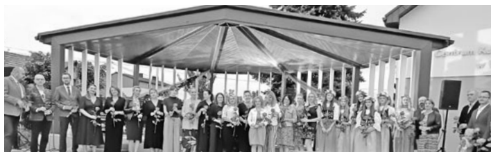
Wydarzenie tradycyjnie zgromadziło przedstawicieli placówek, instytucji, organizacji, mieszkańców

Organizatorami imprezy byli: Gminna Biblioteka Publiczna w Miedźnej z siedzibą w Grzawie, Gminny Ośrodek Kultury w Miedźnej z siedzibą w Woli oraz Urząd Gminy w Miedźnej. » pk