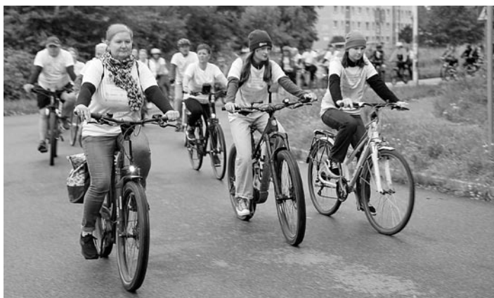
Lubimy jeździć na rowerze, a rajd jest jednym z tego przykładów