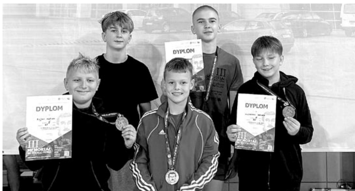
To kolejna udana impreza naszych zapaśników