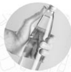
szklane butelki wielokrotnego użytku do 1,5 litra