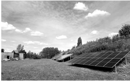
Gmina Miedźna inwestuje w odnawialne źródła energii. Stąd kolejna taka instalacja na oczyszczalni ścieków w Woli