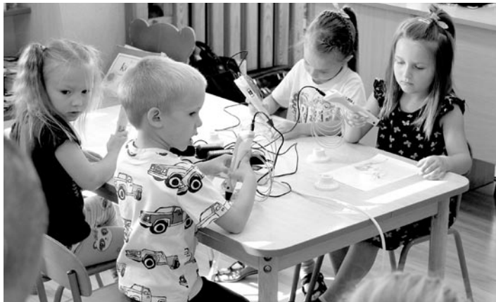
Zajęcia to połączenie nauki i zabawy