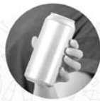
metalowe puszkę o pojemności do 1 litra