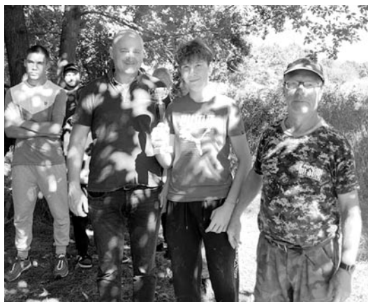
W zawodach udział wzięło 25 uczestników