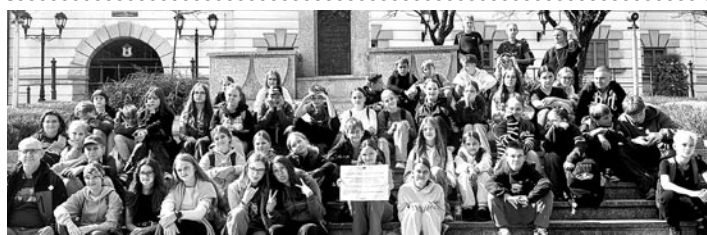
To były ciekawe i inspirujące spotkania