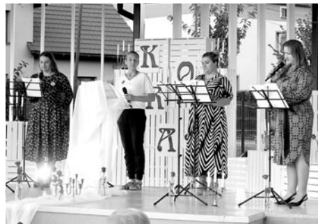
Impreza odbyła się w muszli koncertowej w Woli