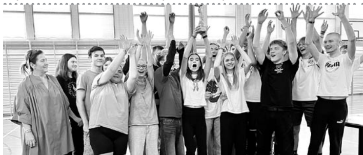
To był dzień pełen sportowych emocji