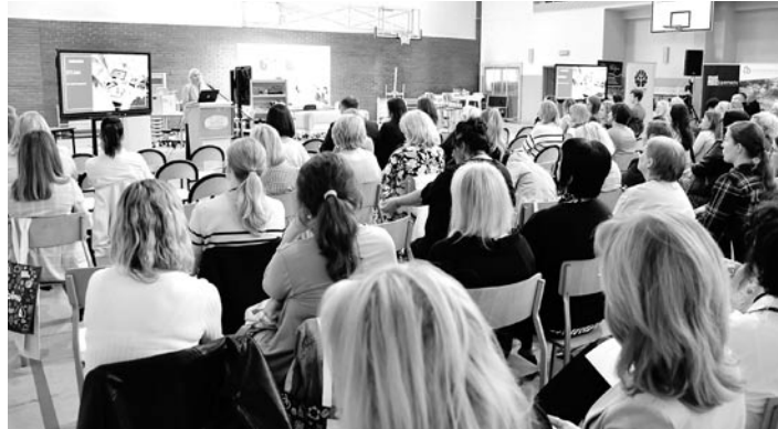
W gilowickim liceum spotkali się nauczyciele, pedagodzy i samorządowcy z całego regionu