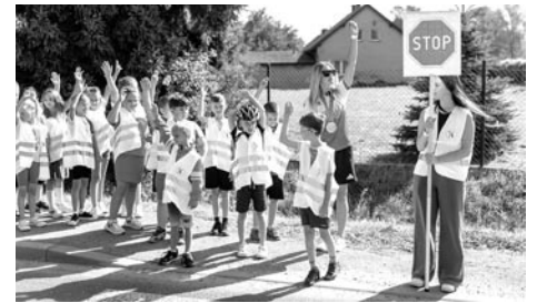
Uczniowie z Góry wiedzą, jak bezpiecznie zachować się na drodze