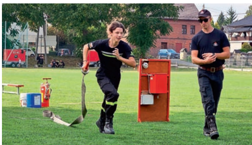
Zawody rozegrano w dwóch kategoriach