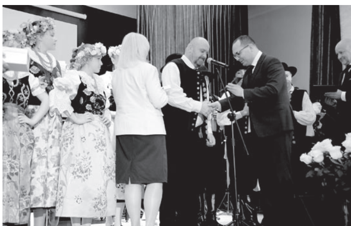
Na wniosek Wójta Gminy Miedzna „Frydkowianie” zostali wyróżnieni przez Ministra Kultury i Dziedzictwa Narodowego