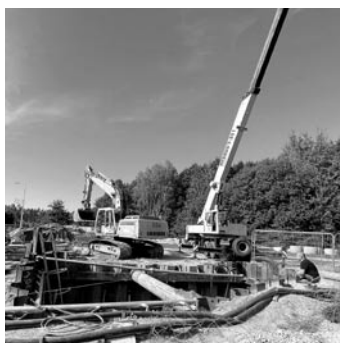
Trwa modernizacja przepompowni ścieków w Woli przy ul. Lipowej

Trwają prace realizowane przez Gminny Zakład Gospodarki Komunalnej, związane z budową sieci kanalizacji sanitarnej tłocznej i grawitacyjnej w Woli i Miedznej-Bodzowie. Jest to inwestycja nierozzerwalna z inwestycją w Woli, modernizacją przepompowni ścieków przy ul. Lipowej. Jeżeli warunki pogodowe pozwolą na terminową i ciągłą realizację prac na przepompowni, to powinny zakończyć się one na koniec października. Przypominamy, że na ten cel gmina pozyskała środki finansowe z Rządowego Funduszu „Polski Ład” – Program Inwestycji Strategicznych w wysokości prawie 5 mln zł.