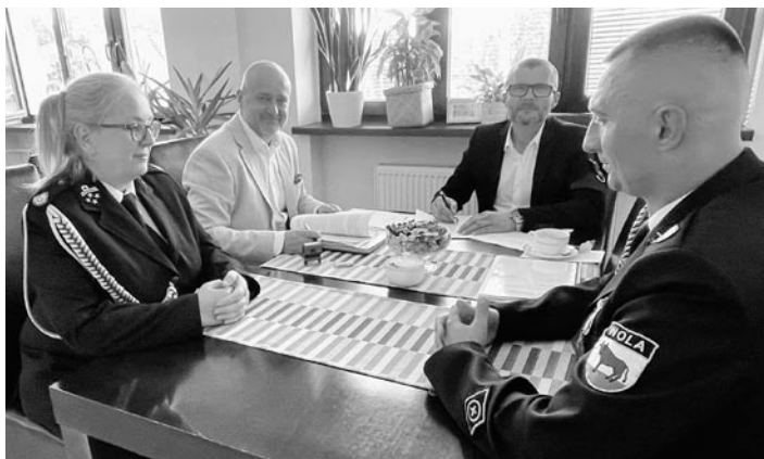
Nowa remiza zostanie wybudowana na terenie dawnej zajezdni autobusowej

Łączny koszt inwestycji to 10 mln 499 tys. zł, w tym dofinansowanie z Rządowego