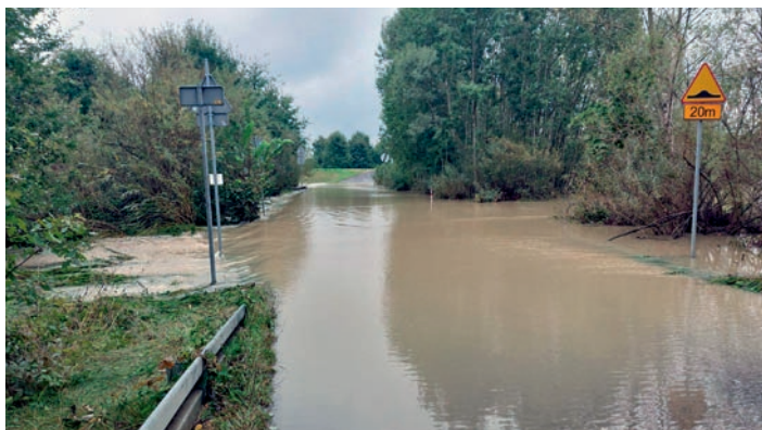
Tak wyglądała droga prowadząca na most Bronisław w Woli

15 września starosta pszczyński ogłosił pogotowie przeciwpowodziowe dla gminy Miedzna (odwołane 27 września). Dzień później rząd wprowadził na 30 dni stan klęski żywiołowej na obszarze części województw dolnośląskiego, opolskiego oraz śląskiego, w tym m.in. w powiecie pszczyńskim. Ma to usprawnić działa-