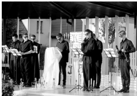
Niezwykłą interpretacją zachwyciła młodzież z gilowickiego liceum