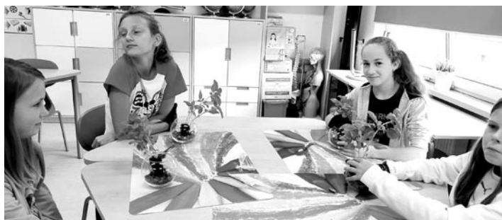
Uczniowie wzięli udział w praktycznych warsztatach zielarskich (FOT. ZSP MIEDŹNA)

Wzrok, dotyk, smak i węch – wszystkie te zmysły osiągnęły niesamowity rozwój podczas żywej lekcji biologii zorganizowanej przez Gminną Bibliotekę Publiczną w Zespole Szkolno-Przedszkolnym w Miedźnej. Były to praktyczne warsztaty zielarskie, w których uczniowie klasy Vb mieli możliwość poznać różne rośliny zielarskie i sposoby ich zastosowania w lecznictwie, jak i kulinarnie,