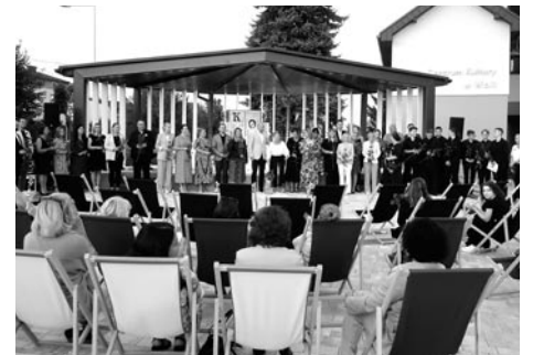
Wydarzenie integruje różne środowiska gminy Miedźna