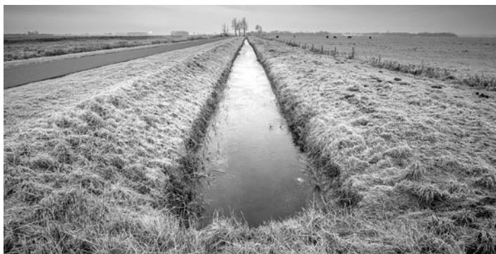
ZDJEŃIE FOGŁADOWE

Przypominamy! Od drożności urządzeń melioracyjnych zależy m.in. prawidłowe odprowadzanie wód opadowych mające większe znaczenie podczas ulewnych długo utrzymujących się deszczów. » pk