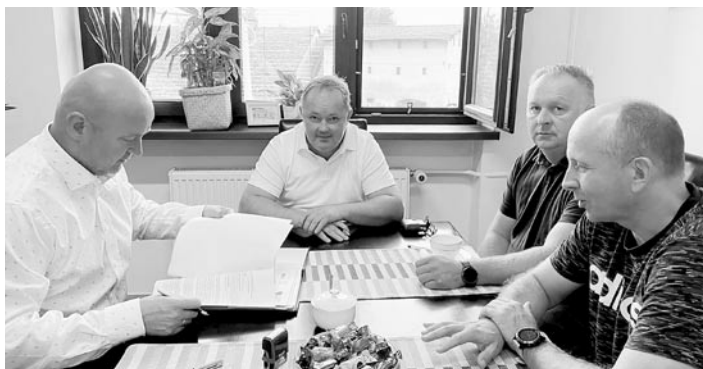
Znów będzie dużo się działo na gminnych drogach

Drugie zadanie, które właśnie rusza to „Przebudowa ul. Polnej w Grzawie i Górze”. Całkowity koszt inwestycji wyniesie 491 tys. 429 zł 28 gr, w tym