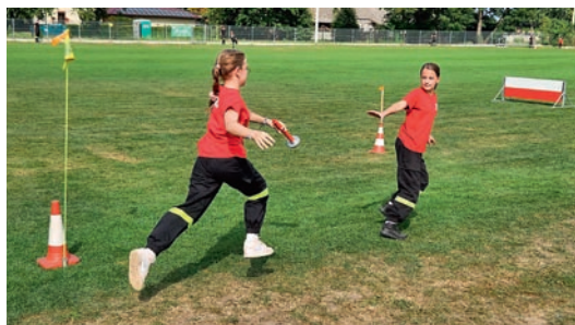
W Miedźnej mogliśmy podziwiać umiejętności naszych druhów