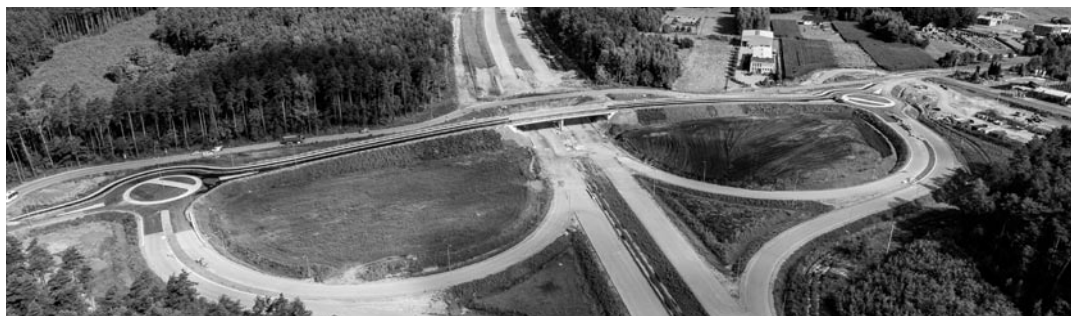
Trwa budowa drogi ekspresowej S1 w naszej gminie. Tak z lotu ptaka prezentuje się stan prac na węźle w Woli na koniec lipca. Na ukończeniu są runda w ramach węzła i odcinek drogi między nimi, wybudowany nad drogą ekspresową