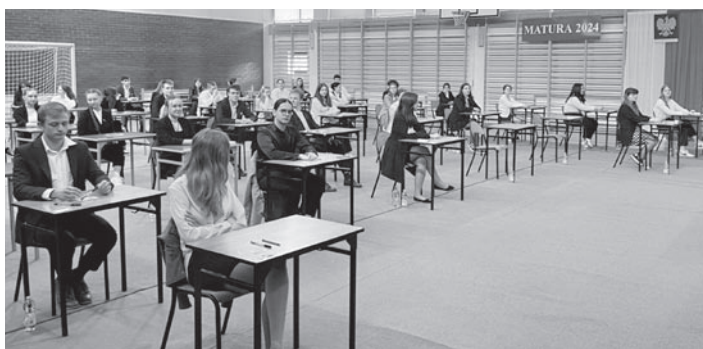
47 uczniów przystąpiło w tym roku do matury w gilowickim liceum (FOT. LO)

Wspaniale na maturze spisali się uczniowie Liceum Ogólnokształcącego im. prof. Zbigniewa Religi w Gilowicach. Wszyscy absolwenci zdali pisemny egzamin dojrzałości, i to koncertowo! Dla przykładu, z egzaminów na poziomie podstawowym uzyskali średnią: z języka polskiego 71% (średnia krajowa to 61%), z matematyki ponad 77% (średnia krajowa to 63%), z języka angielskiego ponad 85% (średnia krajowa to 78%). W przypadku zdecydowanej większości egzaminów wyniki są lepsze od średniej powiatowej, wojewódzkiej i krajowej. Rekordy (wynik przewyższający średnią krajową nawet o kilkanaście punktów procentowych) padły w przypadku egzaminów z biologii i chemii (po 17% więcej), matematyki na poziomie podstawowym i rozszerzonym (po 14% powyżej średniej krajowej), języka polskiego na poziomie rozszerzonym (12% powyżej średniej krajowej). Wśród innych egzaminów, których wyniki są powyżej średniej krajowej, powiatowej i wojewódzkiej znalazły się: język polski na poziomie podstawowym, język angielski na poziomie podstawowym oraz historia. Wszystkim maturzystom serdecznie gratulujemy i życzymy powodzenia w rekrutacji na studia!