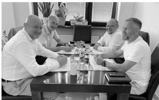
Rozmowy dotyczyły planów inwestycyjnych w tej kadencji na terenie gminy Miedźna