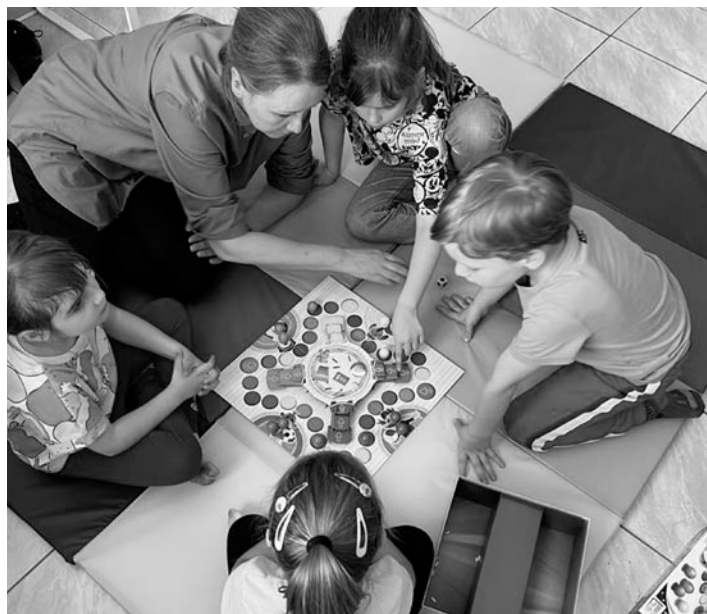
W Przystani dzieci mogą świetnie spędzić wolny czas

Czyli czasu, swojej uwagi. Zawsze mówię: spędzajcie czas ze swoimi dziećmi. Wystarczy 15 minut dziennie rozmowy. Ale bez telefonu, przy wyłączonym telewizorze, nie w trakcie gotowania obiadu. Po prostu, choćby na te kilkanaście minut dziennie należy skupić swoją uwagę tylko na dziecku, na rozmowie z nim. Wtedy relacje są zupełnie inne, lepsze. Dzieci potrzebują rodziców i ich uwagi. A rodzice będą mieli więcej czasu dla dzieci, jeśli podzielą się z nimi obowiązkami domowymi, o których mówiłam wcześniej.