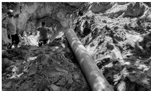
GZGK realizuje prace w zakresie gospodarki wodno-ściekowej w Woli i Miedźnej