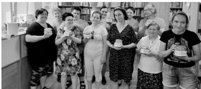
Przetwory to samo zdrowie