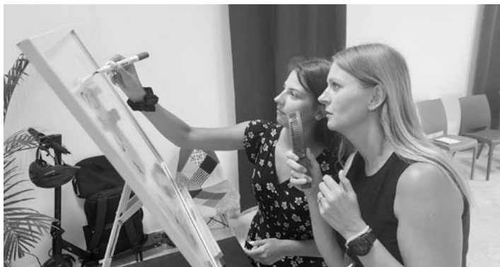
Projekt jest współfinansowany z środków europejskich