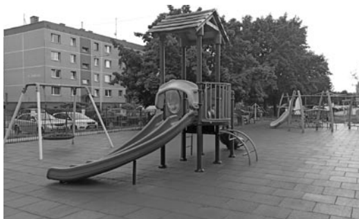
Na placu zabaw przy Szkole Podstawowej nr 1 w Woli jest już nowa nawierzchnia