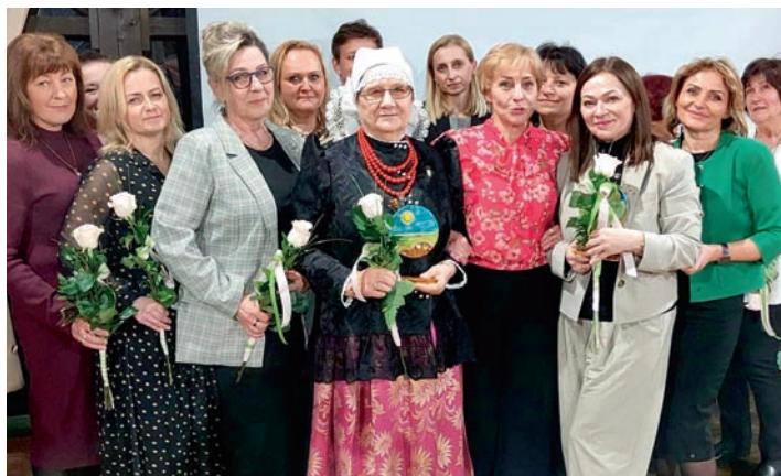
Gratulujemy zasłużonych nagród