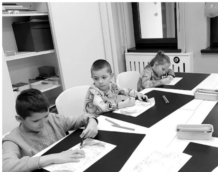
W świetlicy dzieci mogą rozwijać swoje zdolności plastyczne

Na dzieci czekają bezpieczne, kolorowe i nowoczesne pomieszcze-