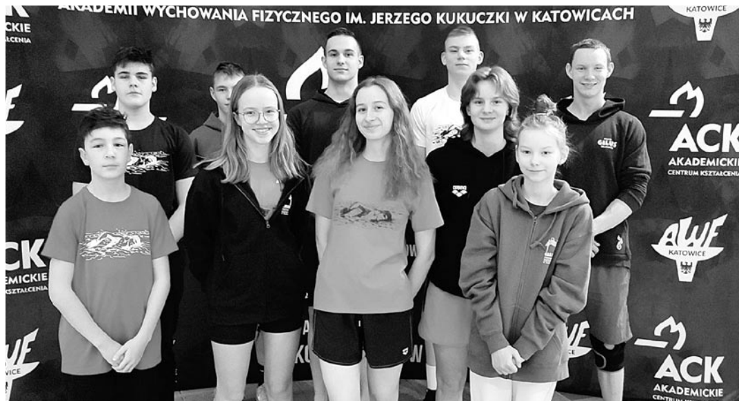
Klub z Gilowic reprezentowało 10 pływaków