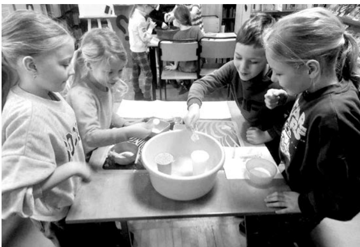
Na czas ferii w bibliotece odbyło się wiele ciekawych zajęć