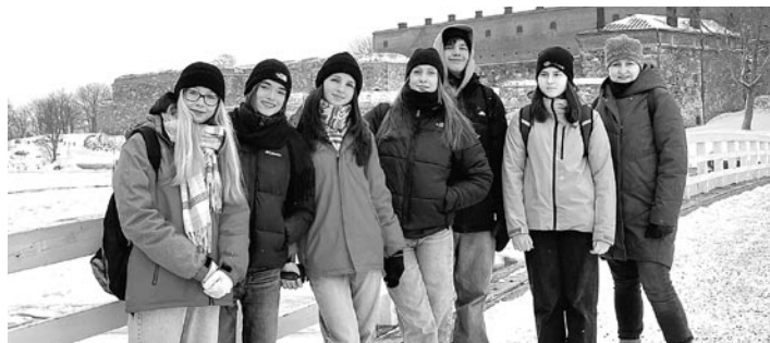
Młodzież z Gilowic spotykała się ze swoimi rówieśnikami z innych krajów