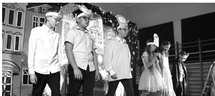
Uczniowie zaprezentowali pięć spektakli teatralnych