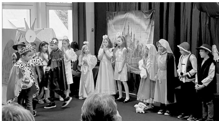
Dla babć i dziadków wystąpiły dzieci z klas I-III