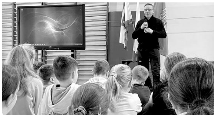
Uczniowie szkoły w Miedznej gościli uczestników Marszu Pamięci

Na nagrobku widnieje napis: „W miejscu tym spoczywają ciała czterdziestu dwóch kobiet, mężczyzn i dzieci, więźniów niemieckiego obozu koncentracyj-