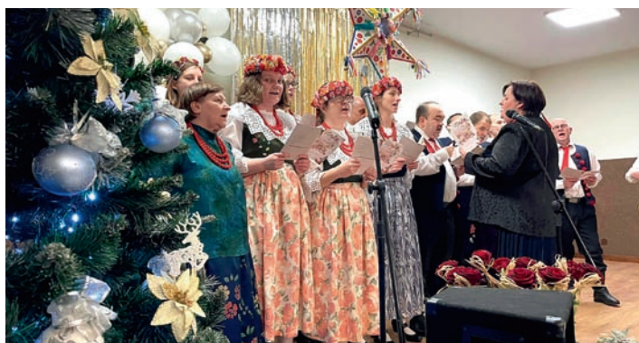
Na scenie Folkowianie