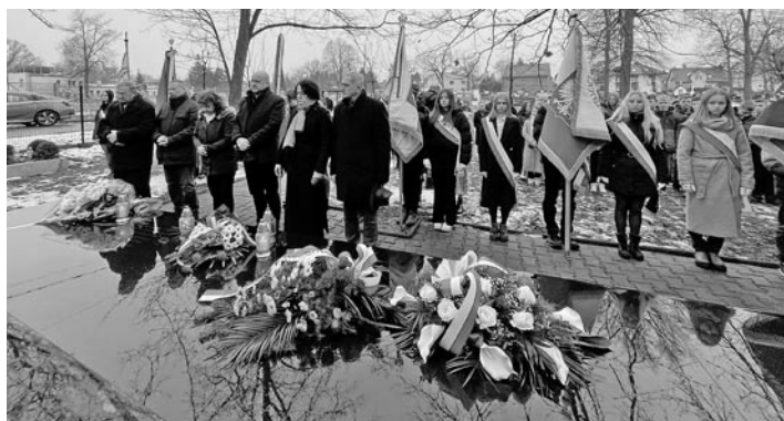
Obchody 79. rocznicy „Marszu śmierci” przy mogile w Miedznej

To już 79 lat... „Marsz śmierci” dla nas wszystkich powinien być przestroga, do czego prowadzi nienawiść.