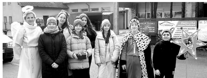
Kolędnicy zbierali środki dla potrzebujących dzieci w Kolumbii