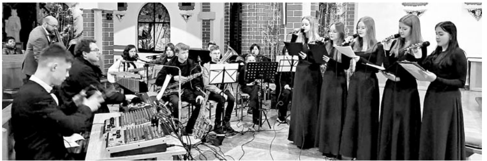
Zespół powstał w połowie ubiegłego roku. Obecnie liczy 22 członków

Sam wychował się na zespołach chrześcijańskich. – Moja mama była członkiem zespołu Przemienienie z Katowic, który swego czasu był bardzo popularny. Jako dwulatek jeździłem z nimi w różne trasy w kraju, a sam zespół grał też za granicą. Tata grał na gitarze hobbyistycznie. To wszystko mnie ukształtowało. Poszedłem do szkoły muzycznej. Najpierw, jako dzieciak, byłem maskotką zespołu, potem stałem się jego członkiem, a następnie prowadzącym – opowiada. Otrzymał ok. 300 utworów dla młodzieży. Zespół się jednak rozpadł, ale partytury zostały. Teraz służą w Górze!