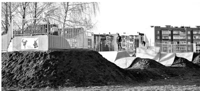
Skatepark powstał za Krytą Pływalnią w Woli. Młodzież chętnie z niego korzysta!

Skatepark to miejsce, w którym aktywnie wolny czas mogą spędzać miłośnicy deskorolek, rowerów, rolek i hulajnóg. Co istotne, inwestycja realizowana była na wyraźną prośbę młodych mieszkańców gminy. W lipcu 2020 r. wystosowali prośbę do wójta o możliwość budowy takiego skateparku. Wskazali potrzeby młodych i uzasadnili swą prośbę mocną argumentacją. Napisali wtedy, że w ostatnich latach można zaobserwować bardzo dynamiczny rozwój sportów ekstremalnych. Sport ten przyciąga coraz szersze grono młodych. Wskazali, że skatepark to miejsce aktywnego wypoczynku dzieci i młodzieży, a i coraz częściej dorosłych. Miejsce, gdzie można uprawiać sport, pojeździć