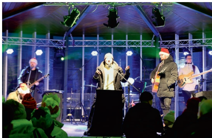
Na zakończenie zespół Redlin zaśpiewał polskie i światowe pieśni świąteczne