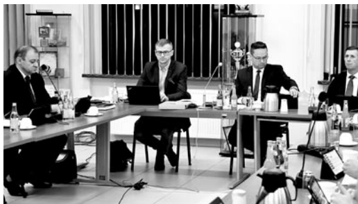
Radni obradują podczas komisji i sesji