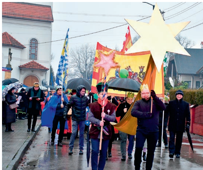
Trzy orszaki połączyły się przy kościele pw. św. Urbana w Woli i wyruszyły we wspólną drogę ku stajance