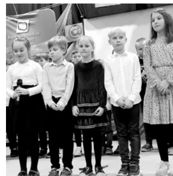
To było bardzo pouczające spotkanie

24 stycznia w Szkole Podstawowej im. Janusza Korczaka w Górze odbyło się niecodzienne wydarzenie. Uczniowie klas I-III wraz z nauczycielami zaprosili swoich dziadków na „Dzień Babci i Dziadka Inaczej”. W wydarzeniu wzięło udział 150 gości. Po części artystycznej odbyła się prelekcja z udziałem pszczyńskich funkcjonariuszy policji. Podjęto tematykę cyberprzestępczości, wyludzeń, bezpiecznego korzystania z sieci. „Musisz wiedzieć i bądź pewien, wszystko co wygrasz do internetu przeżyje razem mnie i Ciebie”, „Choć w internecie czujemy się niewidzialni, korzystaj z niego odpowiedzialnie. Pamiętaj, że prawo w nim również obowiązuje i policja w nim porządku pilnuje!” – te słowa mogli usłyszeć seniorzy z ust swoich wnuków. Po słodkim poczęstunku goście otrzymali upominki od dzieci oraz sponsora, Banku Spółdzielczego w Miedźnej.