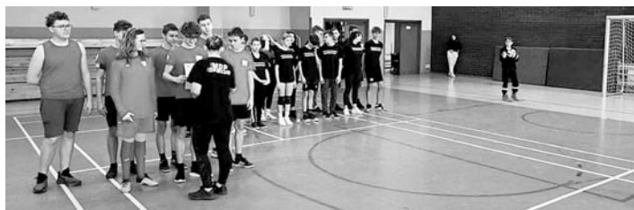
Turniej odbył się na hali w Gilowicach