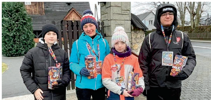
Brawa dla wspaniałych wolontariuszy