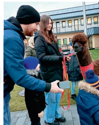
Alpaki były nie lada atrakcją finału w naszej gminie