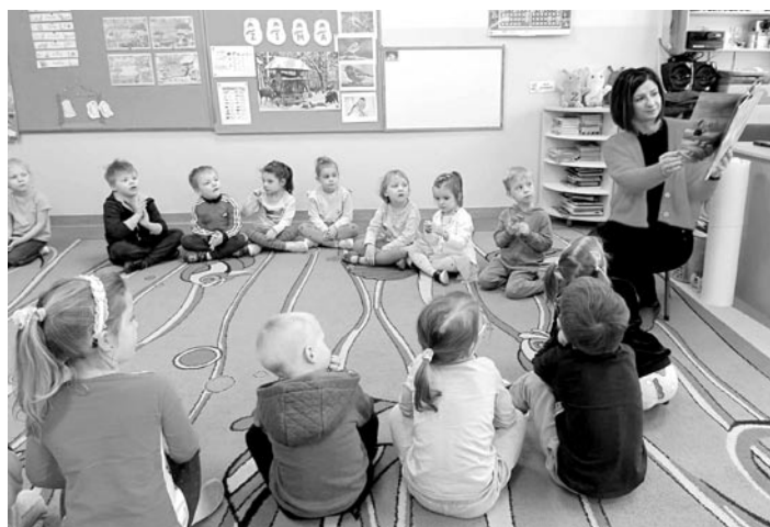
Spotkania bibliotekarek z przedszkolakami to dla najmłodszych cenne doświadczenia

Przedszkola w Gminie Miedźna odgrywają kluczową rolę w rozwijaniu umiejętności czytania i wprowadzaniu dzieci w świat książek. W dobie