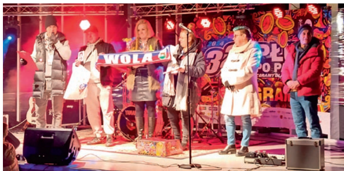
Na scenie było dużo dobrej muzyki, a także ciekawych licytacji