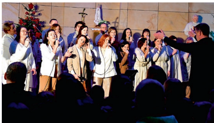
Zespół wystąpił w naszej gminie po raz drugi