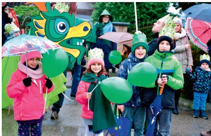
Balony, piękne korony i kolorowe stroje ubarwiły orszak