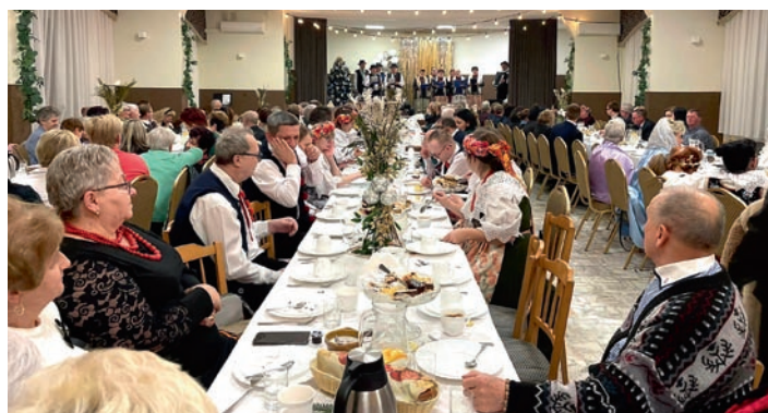
Tego wieczoru wystąpiło 7 zespołów