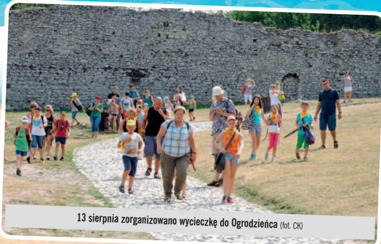
13 sierpnia zorganizowano wycieczkę do Ogrodzieńca