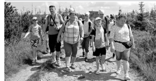
Wycieczkowicze zdobyli też Skrzyżne

W piątek odbyły się lekcje latania na miotle i przechodzenia pod miotłą oraz testy końcowe. Dzieci grały w wielką grę planszową. Puchar domów zdobyła drużyna Ravenclaw, ale wszystkie dzieci wygrały, bo świetnie się bawiły, poznały nowych kolegów i koleżanki i nie nudziły się w domu.