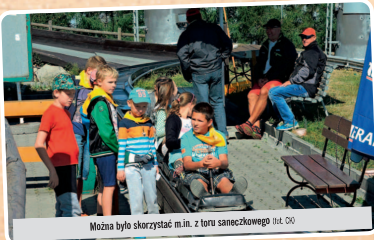
Można było skorzystać m.in. z toru saneczkowego