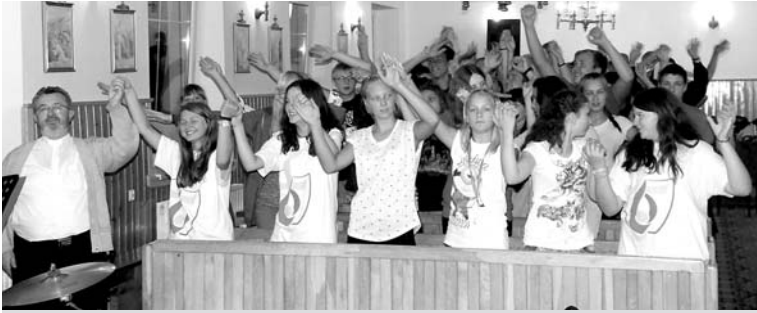
Podczas jednego ze spotkań wieczornych w trakcie pielgrzymki do Łagiewnik

Na początku sierpnia na Jasną Górę doszli pielgrzymi pielgrzymki organizowanej przez parafię w Woli. Pod koniec miesiąca w Łagiewnikach modlono się za dekanat Miedzna.