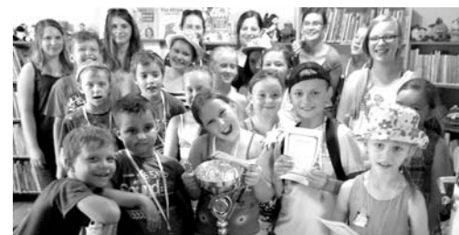
Magiczne spotkania w bibliotece dobiegły końca

i PuppetsPals2, PicsArt, Photo Booth, Drawing Desk, Homestyler. Podczas zajęć powstały filmiki i najróżniejsze zdjęcia. Zorganizowano m.in. turniej i rozwiązano zagadki z aplikacji Quizwanie oraz Słowotok i Wykreślanka. Drugi tydzień poświęcony był serii książek o Harrym Potterze. Tak jak w Hogwarcie, tak i w bibliotece dzieci uczyły się i bawiły w „Magicznej szkole”. Cztery drużyny przez cały tydzień walczyły o puchar domów. W poniedziałek dzieci poznały czarodziejów i czarownice z baśni i bajek oraz mugolskie przedmioty, które służą również czarodziejom, ale do całkiem innych celów. We wtorek na lekcji zielarstwa i eliksirów dzieci najpierw musiały odczytać wiadomość zapisaną magicznym atramentem. Później rozpoznawały lecznicze rośliny (rumianek, pokrzywa, itp.) i ich właściwości. Mali czarodzieje kosztowali magicznej rośliny o słodkich liściach (stewia) oraz miodu, którego nie produkują pszczoły („miód” z mniszka). Każda drużyna na zaliczenie przedmiotu musiała zbudować wulkan i sporządzić eliksir uaktywniający go. W środę dzieci opiekowały się różnymi magicznymi zwierzętami z mitów i legend z całego świata, szukały smoczyczych jajek oraz malowały portrety: gryfa, centaury, pegaza i smoka. W czwartek mali adepci sztuki magicznej poznawali sposoby przepowiadania przyszłości. Szukali również czterolistnej koniczyny, ale niestety Sami Wiecie Kto musiał je wszystkie zebrać.