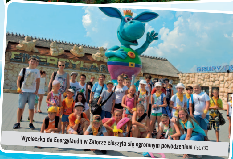
Wycieczka do Energylandii w Zatorze cieszyła się ogromnym powodzeniem