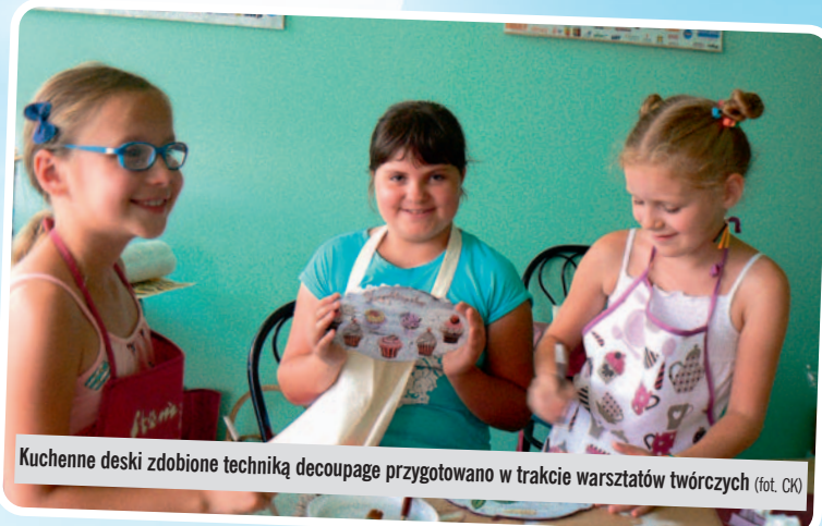
Kuchenne deski zdobione techniką decoupage przygotowano w trakcie warsztatów twórczych