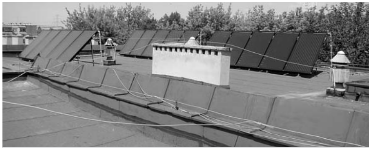
Jednym z działań, mającym na celu ograniczenie emisji jest montaż kolektorów słonecznych

Dzięki opracowaniu dokumentu możliwe będzie przeprowadzenie inwe-