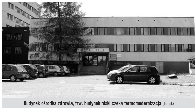
Budynek ośrodka zdrowia, tzw. budynek niski czeka termomodernizacja

Gmina Miedźna ogłosiła przetarg na termomodernizację budynku ośrodka zdrowia przy ul. Poprzecznej 1 w Woli.