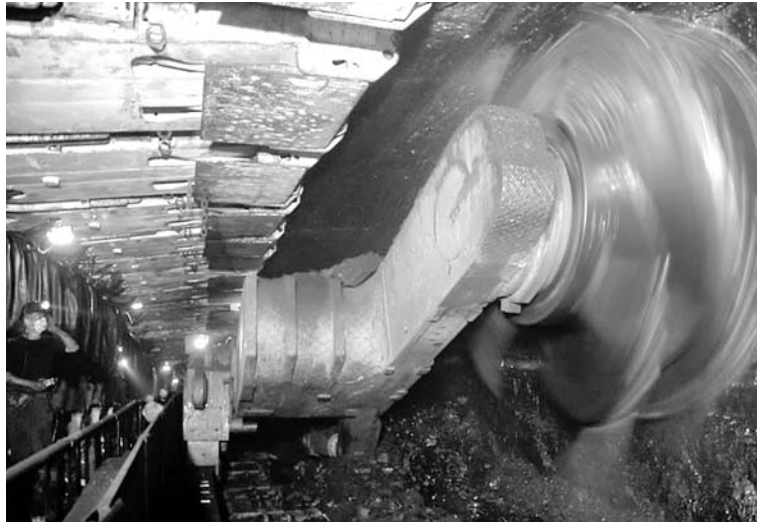
Spółka Studzienice chciałaby ruszyć z wydobyciem w 2020 roku

Spółka złożyła dokumentację złoża do ministra środowiska, który ją zatwierdził. – Rozpoczynamy teraz prace nad raportem oddziaływania na środowisko i projektem zagospodarowania złoża – informuje Kacper Maruszczak, przedstawiciel firmy. Wszystko to powinno być gotowe do końca roku. Potem spółka wystąpi do Regionalnego Dyrektora Ochrony Środowiska z wnioskiem o wydanie decyzji środowiskowej. Wtedy też przeprowadzone zostaną konsultacje społeczne.