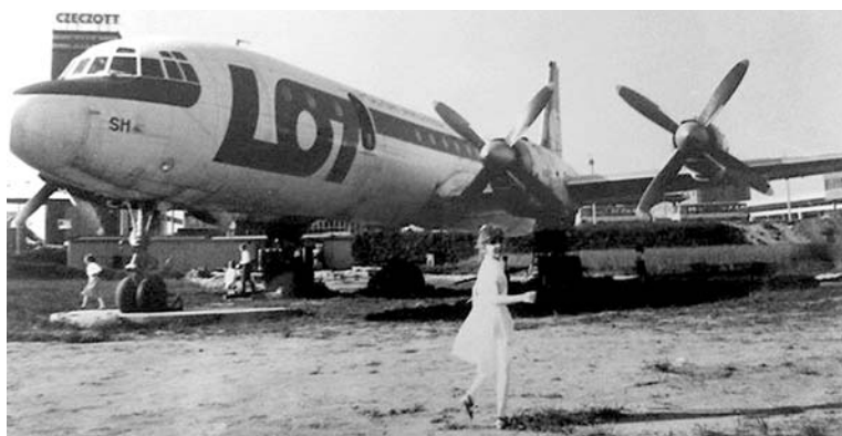
W Woli był nawet samolot!

w każdej klatce, na każdej ławce, każdy plac, trawnik, huśtawka czy piaskownica były zajęte. Klas w szkołach było do 'G', a poprzednie roczniki były jeszcze liczniejsze. Wychodziło się na zewnątrz i wszędzie było pełno ludzi. To było coś bardzo pozytywnego – przyznaje.