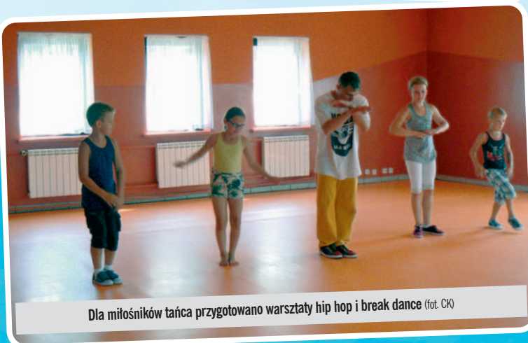
Dla miłośników tańca przygotowano warsztaty hip hop i break dance