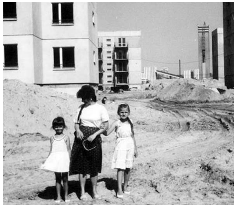
Budowa byłego osiedla WII (fot. facebook)

Jak podkreśla, jest to sentyment głównie do czasów, kiedy wszyscy wspólnie spędzali czas. – Kiedyś wszędzie było pełno dzieci, dosłownie