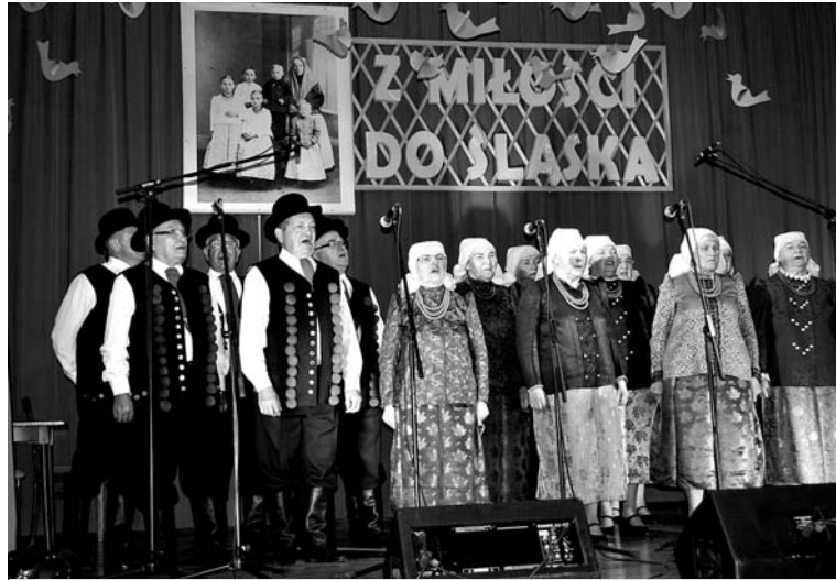
Zespół śpiewaczy „Górzanie” podczas tegorocznego festiwalu folklorystycznego w Woli

Do 2005 roku nie mieli instruktora. Z zespołem zaczął współpracować wtedy Władysław Wróblewski, który do dziś zajmuje się częścią muzyczną, w tym szukaniem starych pieśni śląskich. Zespół prezentuje folklor śląski ze szczególnym uwzględnieniem pieśni z rejonu powiatu