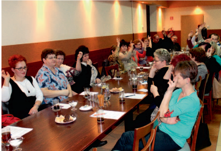
Zebrania poświęcone funduszowi sołeckiemu cieszą się zdecydowanie mniejszym zainteresowaniem niż te sprawozdawcze czy sprawozdawczo-wyborcze. Na zdjęciu – lutowe zebranie w sołectwie Wola

Siłownia powstała dzięki inicjatywie mieszkańców, którzy część środków z funduszu sołeckiego na rok 2015 postanowili przeznaczyć właśnie na ten cel. W ramach tych środków w innych sołectwach udało się w tym roku już m.in. doposażyć nowy stadion w Woli, wybudować parking przy ul. Akacjowej w sołectwie Wola I czy kupić i zamontować lampę przy ul. Księżej w Grzawie. Inne zgłoszone zadania wykonane będą do końca roku. Teraz przed mieszkańcami wszystkich sołectw w gminie kolejne zebrania, podczas których zdecydują, jakie inwestycje realizowane będą w ramach funduszu sołeckiego na rok 2016. – Jest kilka warunków. Zadania zgłoszone do realizacji muszą być zgodne ze strategią rozwoju gminy, muszą być wykonywane na mieniu gminnym i muszą służyć poprawie warunków życia mieszkańców. Te