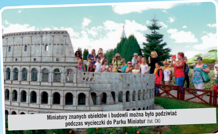
Miniatury znanych obiektów i budowli można było podziwiać podczas wycieczki do Parku Miniatur

Wakacje już za nami. Dzięki warsztatom i wyjazdom przygotowanym przez Gminny Ośrodek Kultury był to czas spędzony aktywnie