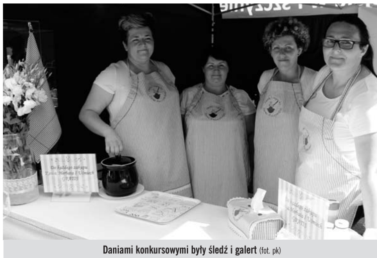
Daniami konkursowymi były śledź i galert

Ale „Chochla” dla „Folkowian” to nie tylko konkurs kulinarny. Cały dochód, który udało się uzyskać pod-