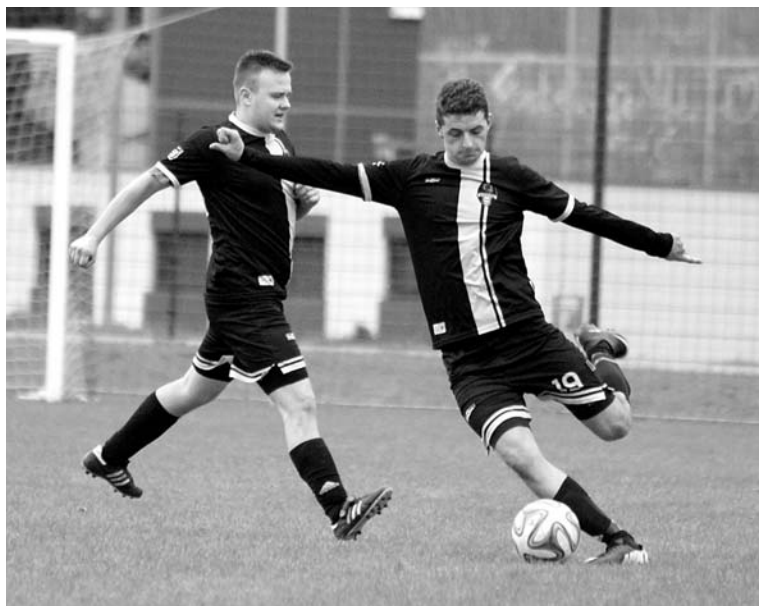
Sokół Wola rozpoczął sezon od dwóch porażek