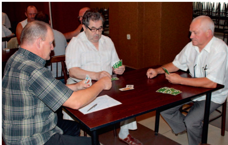
Ostatnie zawody w ramach mistrzostw gminy odbyły się w Górze