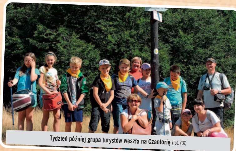
Tydzień później grupa turystów weszła na Czantorię