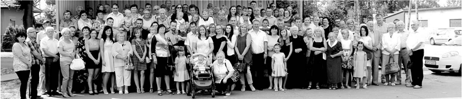
Na tegorocznym zjeździe Liberów pojawiło się ponad 100 osób

W sobotę, 29 sierpnia w Górze odbył się wyjątkowy zjazd rodzinny. Od 1995 roku co pięć lat zjeżdżają się do Góry członkowie rodziny Liberów, która właśnie w Górze ma swoje korzenie. Ostatni zjazd miał