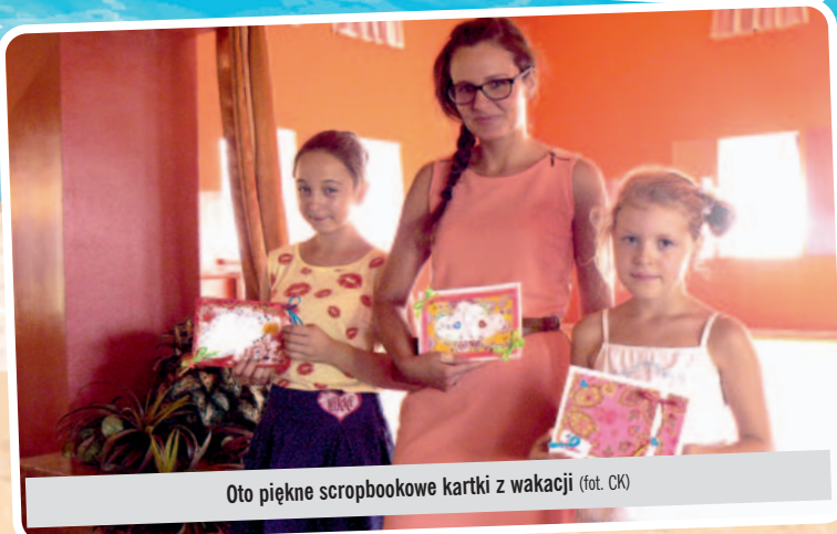
Oto piękne scrapbookowe kartki z wakacji