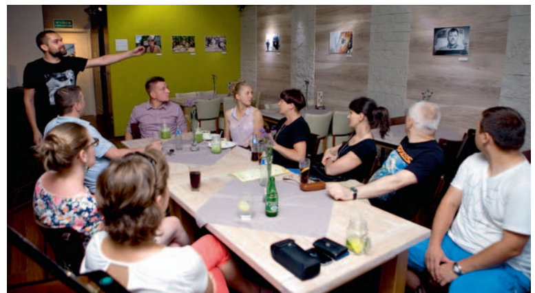
Podczas wernisażu w Bugsy's Jazz Club

– Fotografia to taka dziedzina, która wydaje się bardzo prosta, bo zdjęcia właściwie potrafi robić każdy. Ale