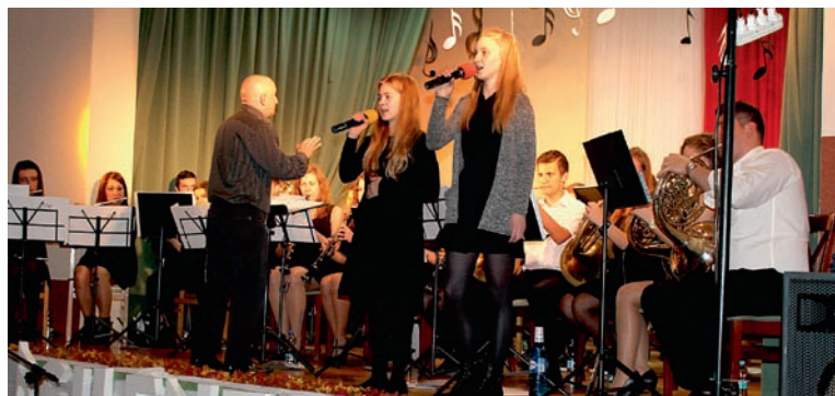
Orkiestra „Silenzio” zaprezentowała ważne dla narodu polskiego pieśni oraz utwory muzyki filmowej, także z solistkami

W ramach świętowania nie proponujemy Państwu marszów, wiecew, ale koncert muzyczny. Mówi się, że muzyka łagodzi obyczaje. W dobie sporów politycznych, tej muzyki potrzebujemy bardzo dużo. Poza tym, wielki udział w odzyskaniu niepodległości miał wybitny muzyk,