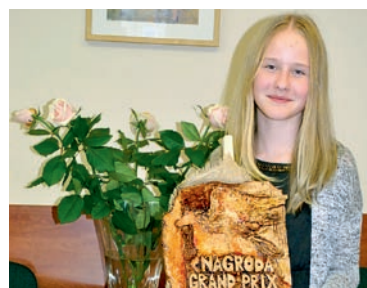
Tysiące pięknych słów

16 listopada w Domu Kultury w Woli odbył się XXV Regionalny Turniej Recytatorski oraz VIII Konkurs Poezji Śpiewanej