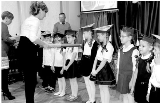
W trakcie uroczystości odbyło się też ślubowanie pierwszoklasistów

25 listopada w Szkole Podstawowej im. Powstańców Śląskich w Miedźnej odbyła się uroczystość z okazji 60-lecia oddania do użytku budynku szkoły. Jest to najstarsza szkoła w gminie. Z zapisów z kronik wynika, że została założona w ok. 1798 r. Na początku zajęcia odbywały się na terenie dzisiejszej posesji państwa Botorów (za tzw. organistówką) oraz kółka rolniczego. Potem szkoła działała w miejscu, gdzie obecnie znajdują się parking i przedszkole. Wciąż było za ciasno, więc rozpoczęto budowę nowego budynku, tego, który funkcjonuje do dziś. Pierwsi uczniowie rozpoczęli