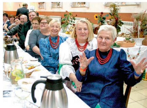
Wieczór zakończył się gościną i wspólną zabawą

Tego dnia świętowano też 150-lecie Kół Gospodyń Wiejskich na ziemiach polskich oraz zorganizowano Gościnę Zespołów Folklorystycznych.