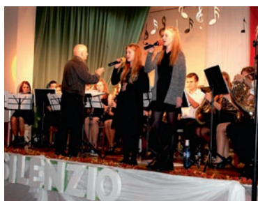
Wolność można wyśpiewać

10 listopada w gminie Miedźna odbyły się obchody Święta Niepodległości – złożono kwiaty pod pomnikiem Powstańców Śląskich, odbył się też koncert