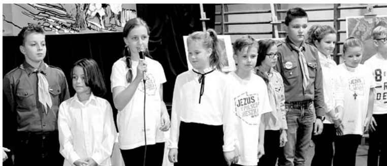
Uczniowie czytali fragmenty publikacji historycznej oraz Biblii