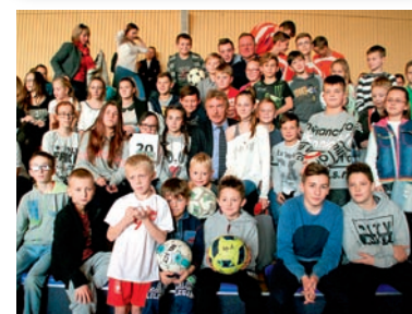
Spotkanie z legendą

23 listopada uczniowie i sportowcy z gminy Miedźna spotkali się ze Zbigniewem Bońkiem, ikoną piłki nożnej i prezesem PZPN