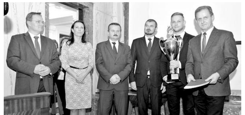
Konkurs „Piękna wieś województwa śląskiego” podsumowano podczas Forum Sołtysów, które odbyło się 24 listopada w sali Sejmu Śląskiego w Katowicach

Zgodnie z art. 35 ust. 1 i 2 ustawy z dnia 21 sierpnia 1997r. o gospodarce nieruchomościami (tekst jednolity z 2015r. poz. 1774 z późniejszymi zmianami) Wójt Gminy Miedźna informuje, że na tablicy ogłoszeń znajdującej się w budynku Urzędu Gminy Miedźna, ul. Wiejska 131, 43-227 Miedźna wywieszony został wykazy nieruchomości stanowiącej własność Gminy Miedźna przeznaczonej do oddania w najem w drodze bezprzetargowej: - lokal użytkowy o pow. 10 m 2 zlokalizowany na I piętrze w Górze, ul. Rybacka 6, 43-227 Miedźna z przeznaczeniem na cele upowszechniania kultury fizycznej i sportu. Informacja dotycząca wykazu dostępna jest na stronie internetowej: bip.miedzna.pl