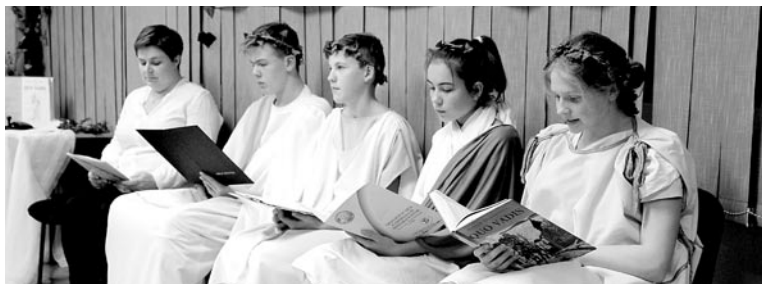
We wspólną akcję zaangażowały się tradycyjnie trzy szkoły