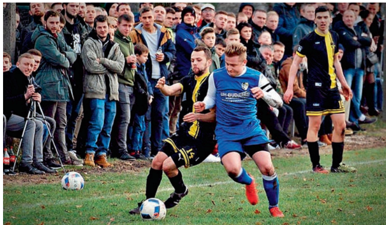
Mecz LKS-u Frydek z Sokółem śledziło ponad 400 kibiców

Liderem klasy A pozostał Sokół Wola, który miał jednak słabszą końcówkę rundy. W trzech ostatnich meczach klub odniósł aż dwie porażki. 5 listopada Sokół przegrał 0:2 w Gardawicach z tamtejszym LKS-em. Tydzień później co prawda dzięki bramce D. Hamerli wygrał u siebie 1:0 z Ogrodnikiem Tychy, ale 20 listopada klub z Woli poległ w derbach gminy Miedźna. We Frydku przegrał z LKS-em 3:4 (bramki dla