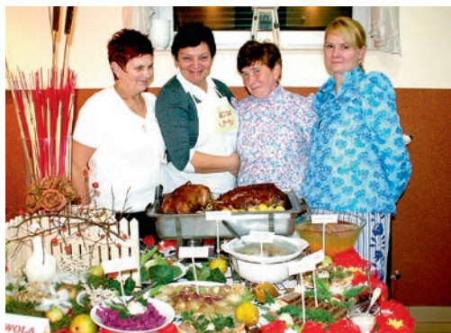
Konkurs wygrała KGW z Woli, które będzie reprezentować gminę w konkursie powiatowym