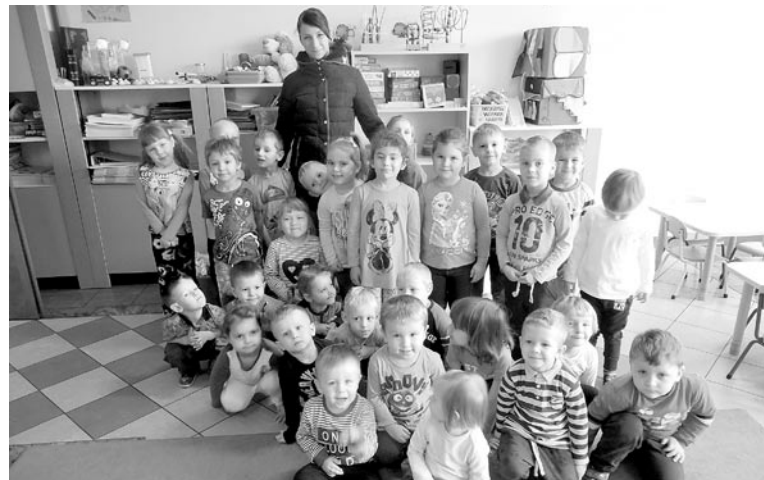
Dzieci pomogły zwierzętom