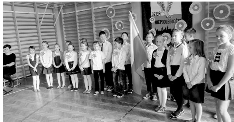
W szkole zorganizowano Konkurs Pieśni Patriotycznej

Narodowe Święto Niepodległości to dzień wyjątkowy dla każdego Polaka. Z tej okazji w Szkole Podstawowej im. S. Hadyny 8 listopada odbył się Konkurs Pieśni Patriotycznej. Uczniowie każdej klasy przygotowali występy, w czasie których zaprezentowali najbardziej znane, ale i rzadko spotykane pieśni związane tematycznie z tym ważnym świętem. Nastrój uroczystości był bardzo podniosły i wyjątkowy, a poziom występów bardzo wysoki. Jury nie miało łatwego zadania, ale po obradach ogłosiło wyniki. W kategorii klas I-III wygrała kl. IIIC, a w kategorii klas IV – VI - kl. IV B. Publiczność nagrodziła klasy IIIB i V. » SP Frydek