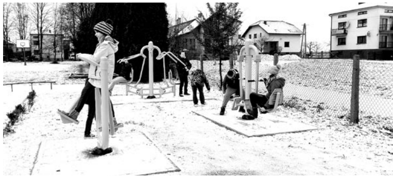
Z nowych urządzeń można skorzystać w Woli, Miedznej i Górze