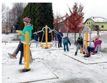
Są nowe siłownie zewnętrzne

W gminie Miedźna dostępne są trzy nowe siłownie zewnętrzne – na terenie SP nr 1 w Woli, SP w Miedznej oraz SP w Górze