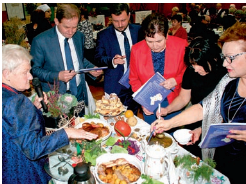
Koła z gminy Miedźna serwowały pyszne dania, a tematem przewodnim była gęsina