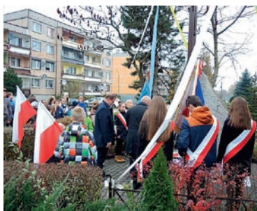
Władze gminy oraz społeczność SP nr 1 oraz Zespołu Szkół w Woli złożyli kwiaty pod pomnikiem Powstańców Śląskich w Woli